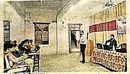
काउंसिलिंग के दौरान छात्र

शनिवार को शासकीय इं. वि. स्नातकोत्तर महाविद्यालय, कोरबा में आईसीआईसीआई बैंक के सेल्स ऑफिसर के पद हेतु महाविद्यालय की कैरियर काउंसिलिंग एवं प्लेसमेंट समिति की ओर से प्लेसमेंट का आयोजन किया गया।